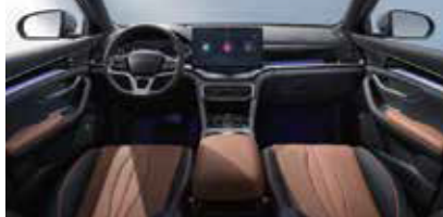
Schwarz und braun