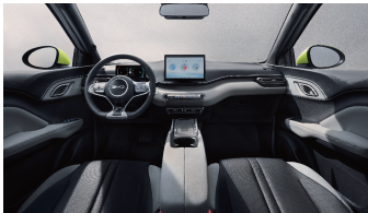
Noir / Gris