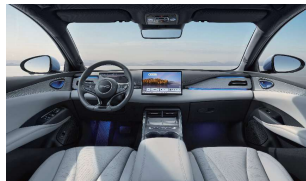
Schwarz & Grau