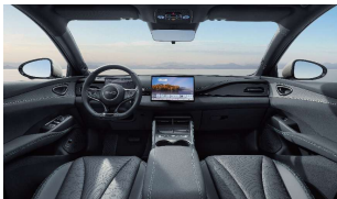
Blau & Schwarz