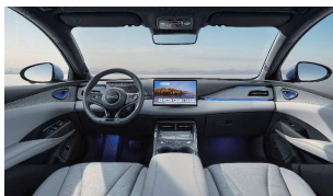
Noir & Gris Perle