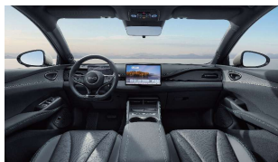
Bleu & Noir